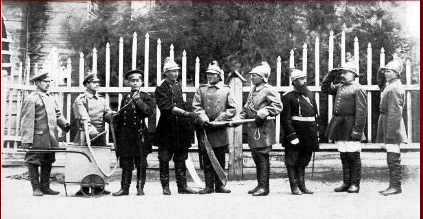
Пожарная команда 1917 года