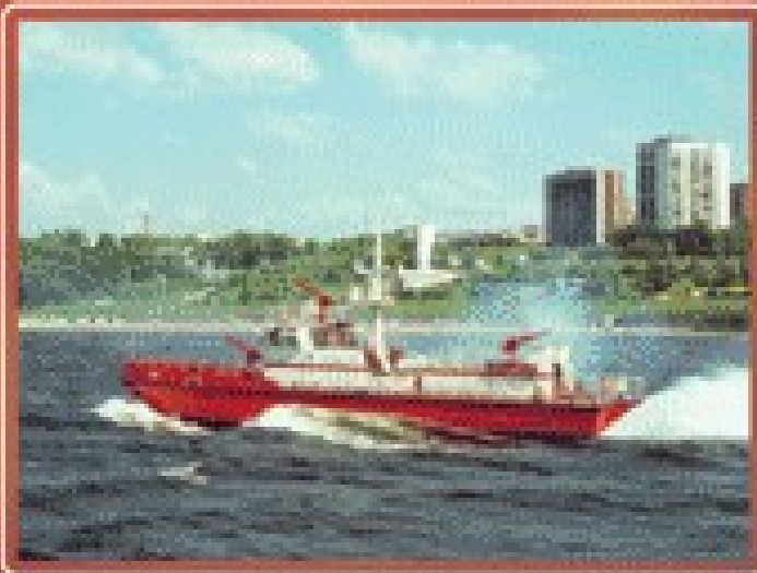
■ Тревога на пожарном судне.

Сейчас Пожарная охрана России располагает разнообразной современной пожарной техникой, позволяющей успешно бороться с пожарами любой сложности