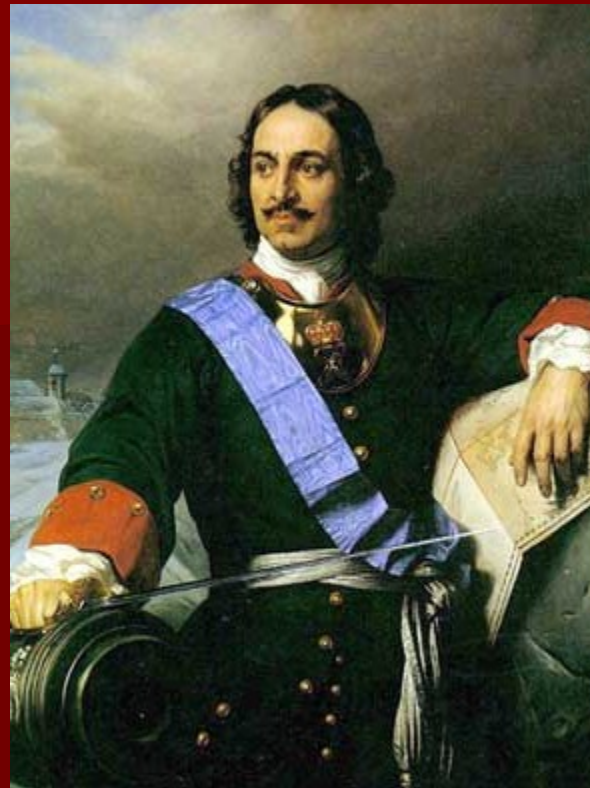
Пётр I 1672 — 1725)

Определенный шаг вперед пожарное дело получило при Петре I. Он запретил строить в Петербурге деревянные дома. Всем жителям города было предписано чистить печные трубы в своих домах один раз в месяц. За топкой печей следили "объезжие головы".