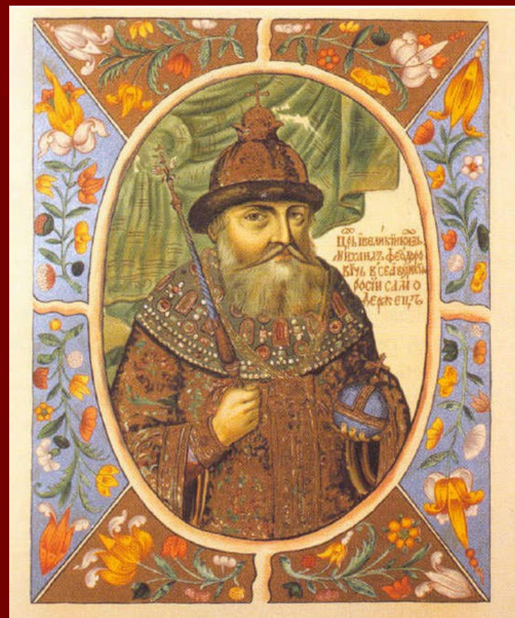
Михаїл Фёдорович Рома́нов (1596—1645)

При Михаиле Федоровиче Романове, в 1620-е годы, в Москве была учреждена пожарная команда. Первоначально в ее состав входило 100 человек, с 1629 года - 200 (в летнее время до 300). Команда имела в своем распоряжении водоливные трубы (ручные насосы), бочки, ведра и прочее имущество. Постоянно дежурили 20&nbsp;извозчиков с лошадьми. Для этого ответственный за тушение пожаров собирал с москвичей подати.