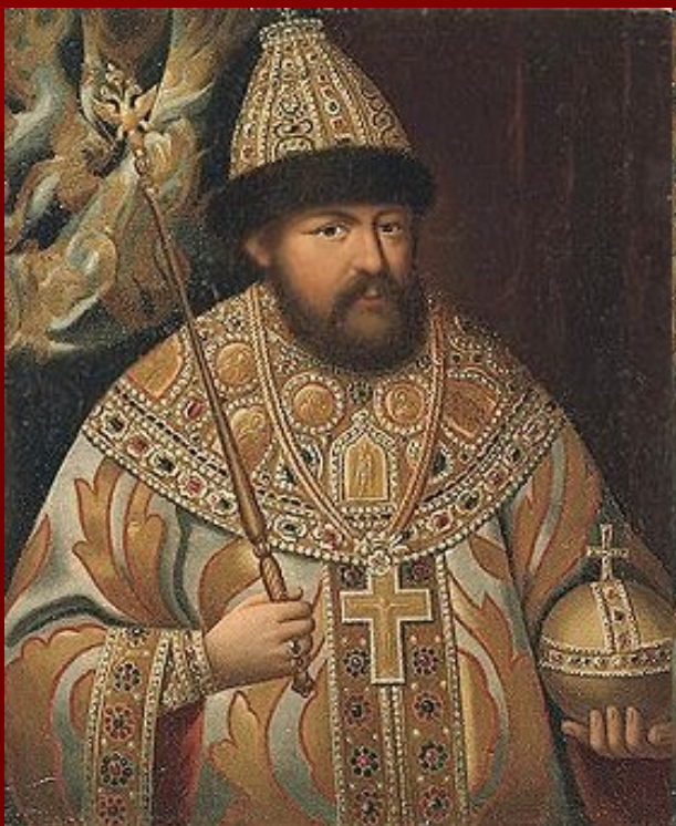
Царь Алексей Михайлович 1645-1676

30 апреля 1649 года государь Алексей Михайлович утвердил "Наказ о градском благочинии" – первый общегосударственный документ, сформулировавший организацию мер по пожарной безопасности на Руси.