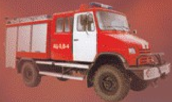
■ Современная автоцистерна.

При тушении лесных пожаров с успехом применяется авиация.